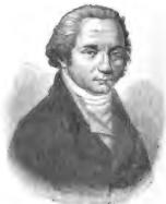
Franz Joseph Gall.

bis 1843), der aus einer Notiz in Cullens «Materia medica» über die wechselsehrähnliche Symptome hervorrufende Wirkung der Chinarinde die Anregung zur Aufstellung seines Systems empfing, dessen Kern der Gedanke ist, dass die Wirksamkeit der Arzneimittel darauf beruht, dass sie ähnliche Symptome, wie